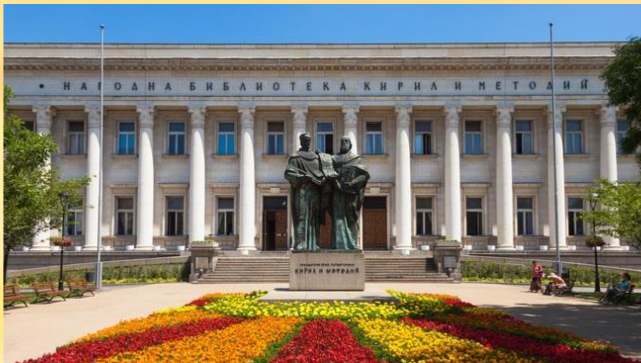
Пред Националната библиотека в София

Едни от най-въздействащите паметници на Св. Кирил и Методий в България: